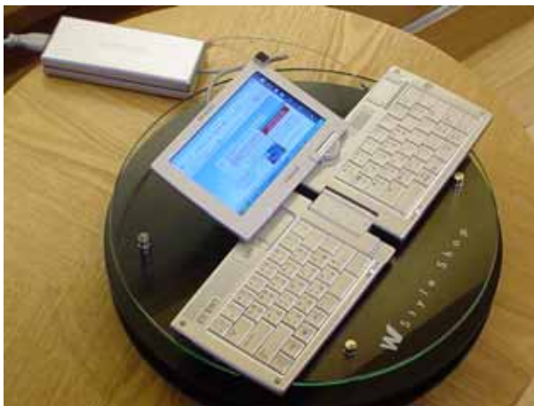
(1階に展示された端末 デラックスMITs)