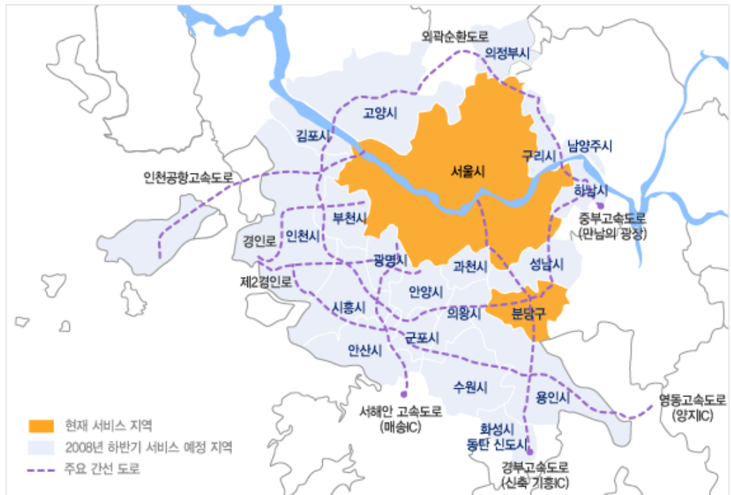
【図表1】KTのWIBROサービスエリア（2008年4月現在） ① （脚注1）