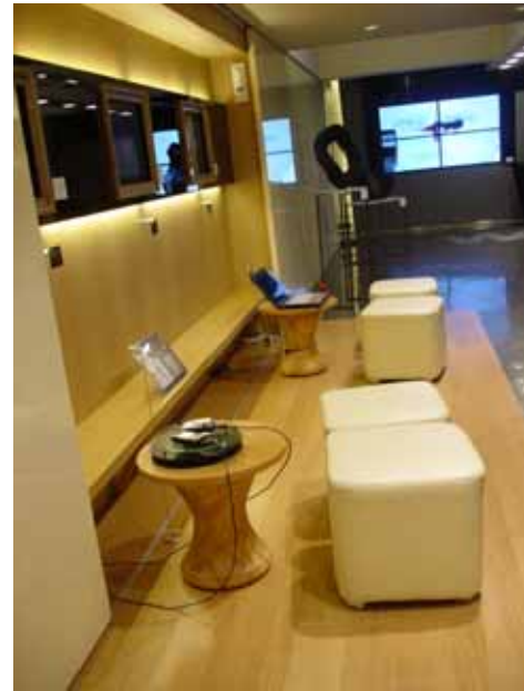
(1階の展示スペース)