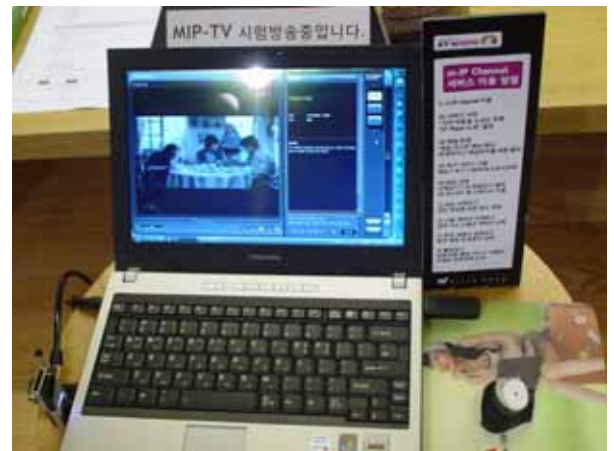
(2007年12月にはWIBROを利用した モバイルIPTV実験デモも行われていた)