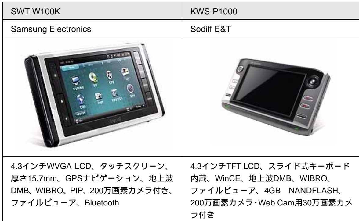
【図表5】KTのWIBRO PMP ( Portable Multimedia Player )