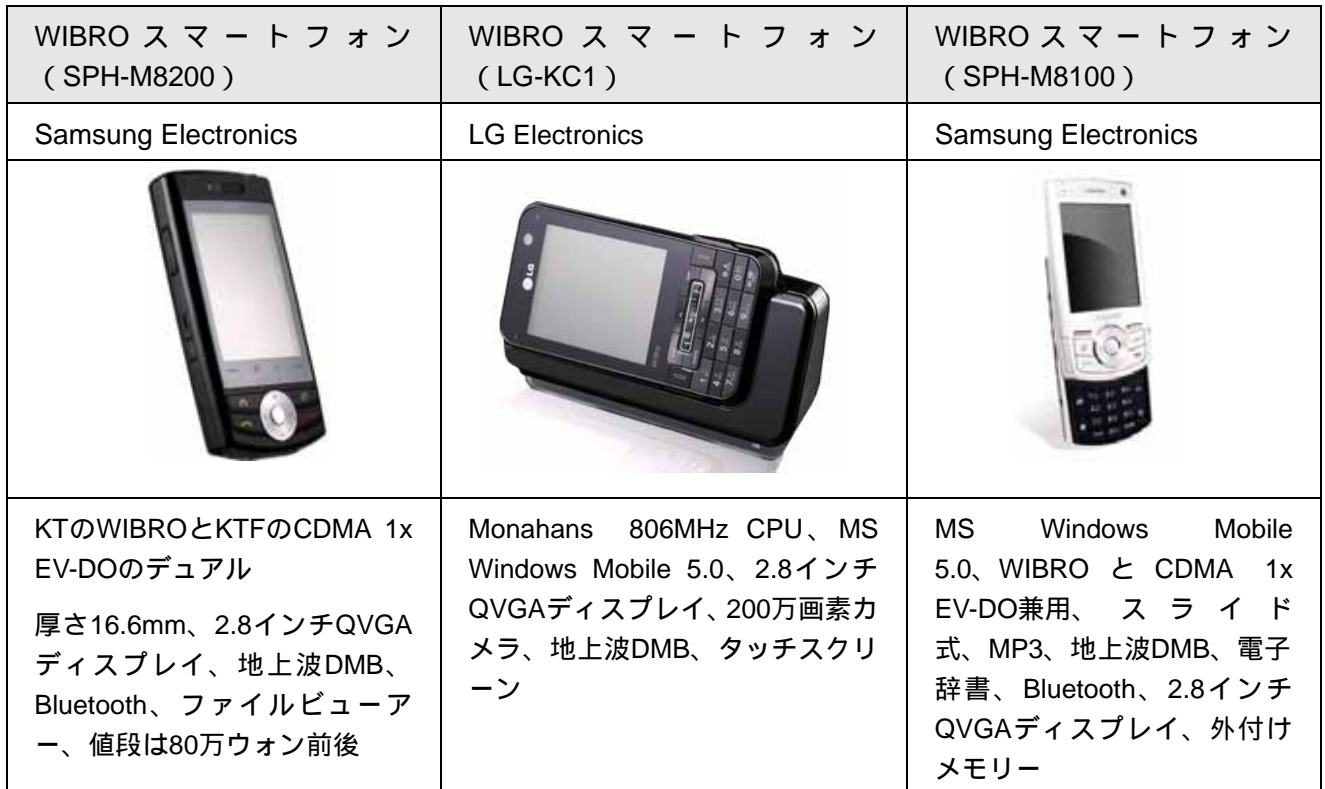
【図表3】KTのWIBROスマートフォン